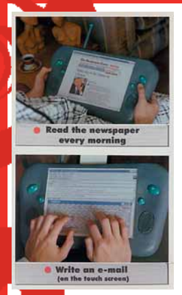
Láminas presentadas en el concurso

Algunas características del DIGIBOOK son su pantalla LCD sensible al tacto funcionando tal como lo hace un "mouse", además de disponer de 2 parlantes y micrófono.