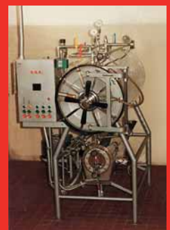
Aspecto previo del autoclave sin la intervención del diseñador.