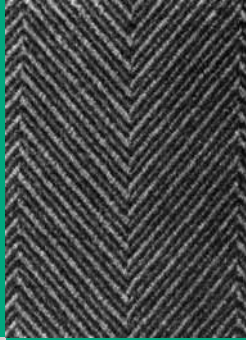
Sobretudo 9240/B - Fibratex